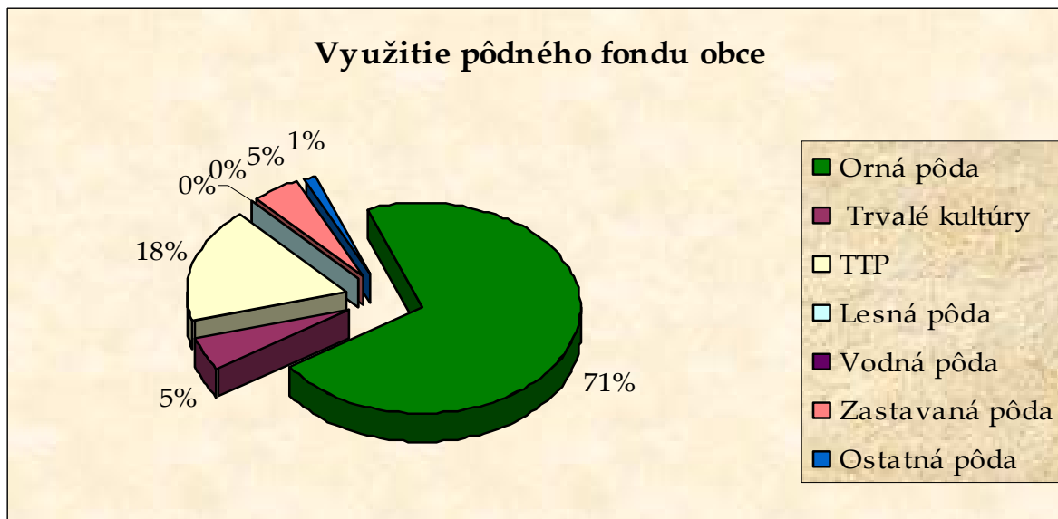
Graf č. 1 - zdroj: tabuľka č. 1

Poľnohospodársku pôdu v obci využíva Agrodružstvo Granč – Petrovce.